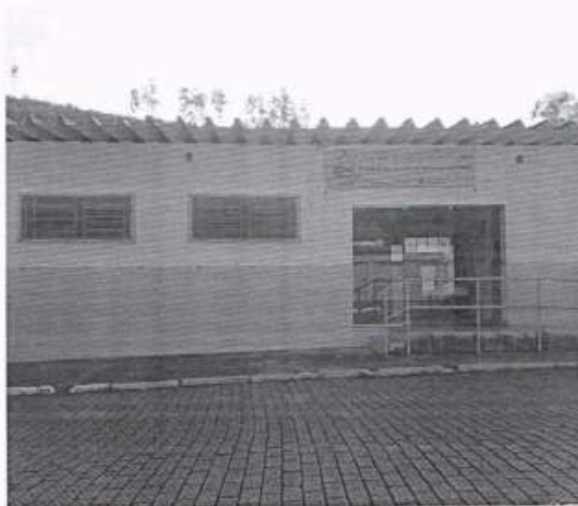
Figure 4- Secretaria Municipal de Saúde

A Vigilância em Saúde se concentra dentro da Secretaria Municipal de Saúde e possui os serviços de Vigilância Epidemiológica e Sanitária, além da Farmácia Municipal onde está localizado o Dispensário de Medicamentos.